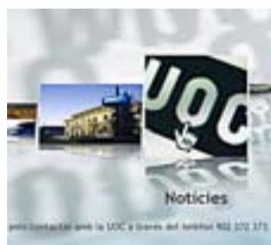
Captura de MediaUOC.

COMUNICACIÓ. La Universitat Oberta de Catalunya (UOC) disposa d'un nou canal de televisió a la carta. Els estudiants podran llegir notícies i consultar les notes amb el comandament a distància del televisor, sempre que tingui connexió a internet. MediaUOC s'estrena 15 anys després de la creació d'aquesta Universitat.